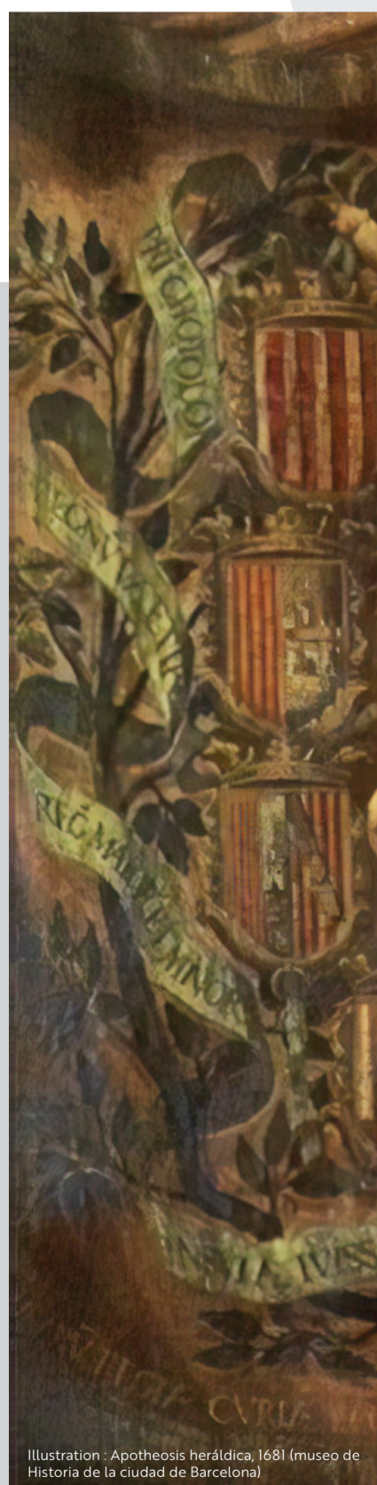
Illustration : Apotheosis heráldica, 1681 (museo de Historia de la ciudad de Barcelona)

NICE - CAMPUS CARLONE - Salle du Conseil